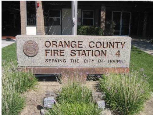
Apparence : cour extérieure propre