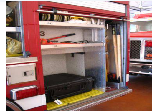
Peinture au sol : les espaces sont identifiés

Pourquoi un environnement 5S est important pour les pompiers?