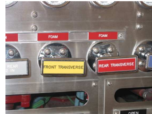
Management visuel : Les panneaux d'affichage sont clairs, colorés et visuels