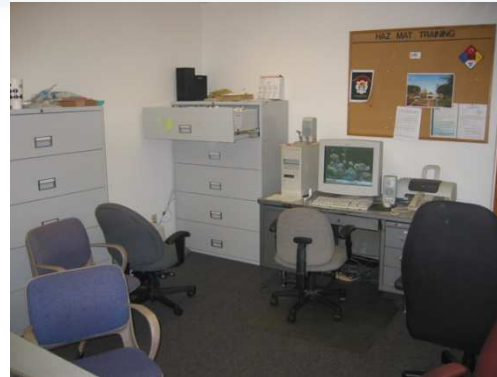
Bureau ordonné : les bureaux sont organisés